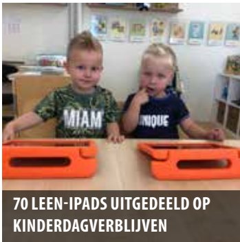
70 LEEN-IPADS UITGEDEELD OP KINDERDAGVERBLIJVEN