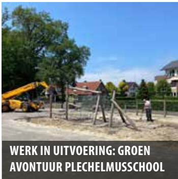
WERK IN UITVOERING: GROEN AVONTUUR PLECHELMUSSCHOOL