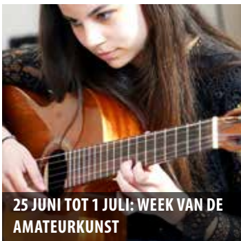
25 JUNI TOT 1 JULI: WEEK VAN DE AMATEURKUNST

Uitgave 9 - van 28 juni t/m 19 juli 2022