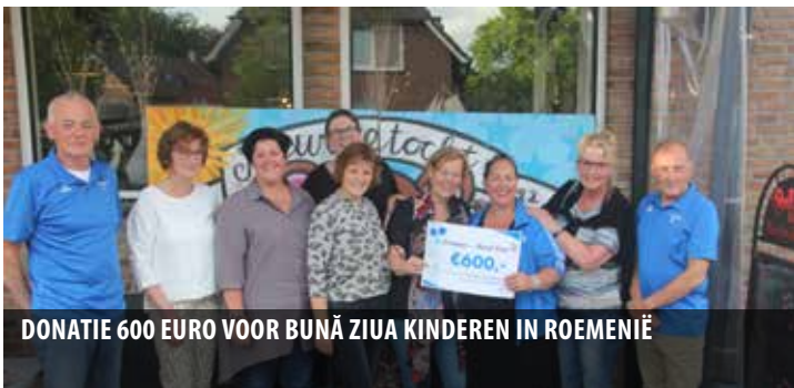
DONATIE 600 EURO VOOR BUNĂ ZIUA KINDEREN IN ROEMENIË