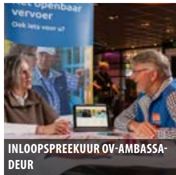
INLOOPSPREEKUR OV-AMBASSA- DEUR