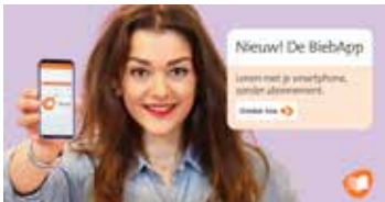
DE BIEBAPP: LENEN ZONDER ABONNEMENT

Uitgave 2 - 6 februari tot 27 februari 2024