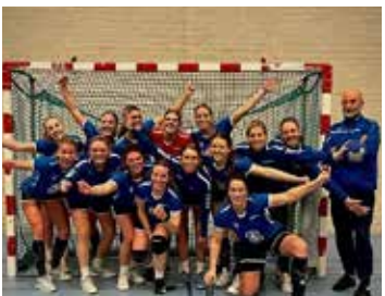
HANDBALCLUB SV DE LUTTE VERLENGT CONTRACT HOOFDTRAINER