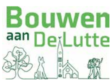
UPDATE BOUWEN AAN DE LUTTE