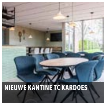
NIEUWE KANTINE TC KARDOES