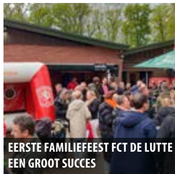
EERSTE FAMILIEFEEST FCT DE LUTTE EEN GROOT SUCCES