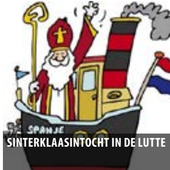
SINTERKLAASINTOCHT IN DE LUTTE