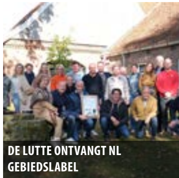
DE LUTTE ONTVANGT NL GEBIEDSLABEL