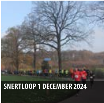
SNERTLOOP 1 DECEMBER 2024

Uitgave 15 - 5 november tot 26 november 2024