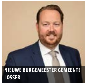
NIEUWE BURGEMEESTER GEMEENTE LOSSER