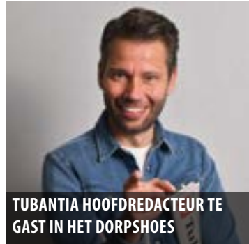
TUBANTIA HOOFDREDACTEUR TE GAST IN HET DORPSHOES